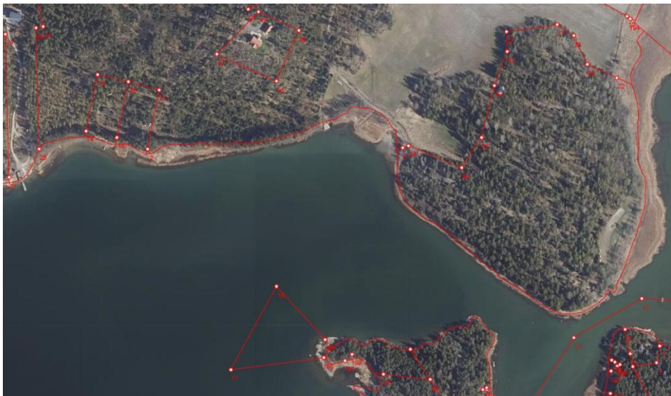
Maanmittauslaitoksen ilmakuva kaava-alueesta.