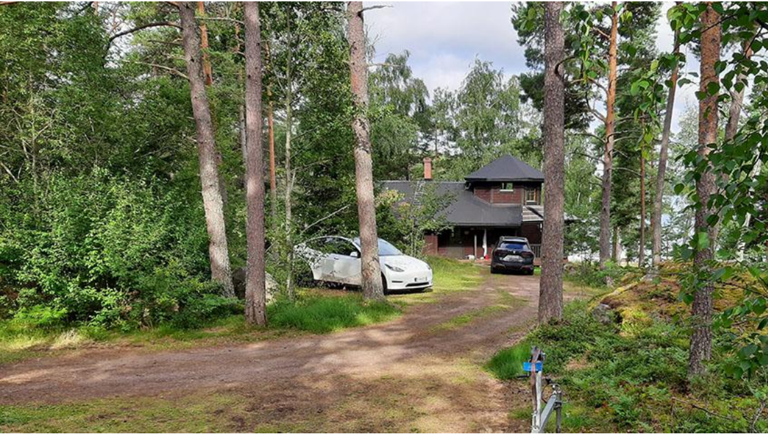
Kuva 3. Kaavakorttelin 2 rakennetun tontin päärakennus.