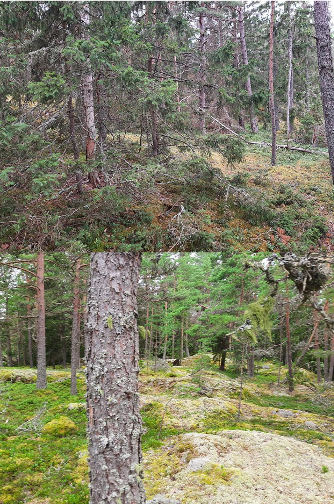
Kuvat 10 ja 11. Korttelin 1 omakotitontin sisäosaa, mihin rakennusala on osoitettu.