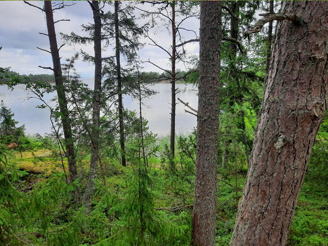
Kuvat 8 ja 9. Korttelin 1 omakotitontin rantaa.