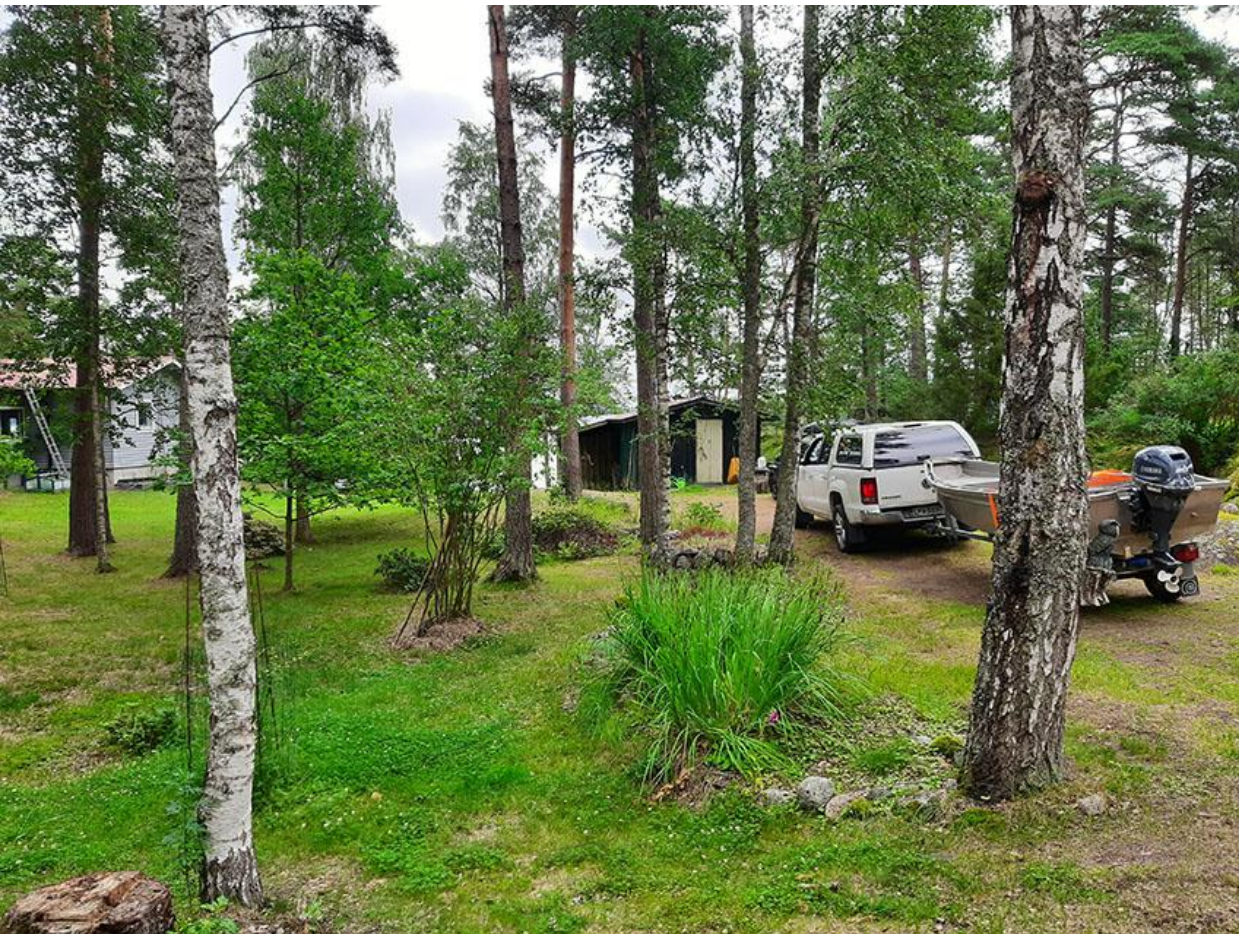
Kuva 2. Kiinteistön Myggsala 3-11 pihapiiri, jossa näkyy päärakennuksen itäosa ja talousrakennus.