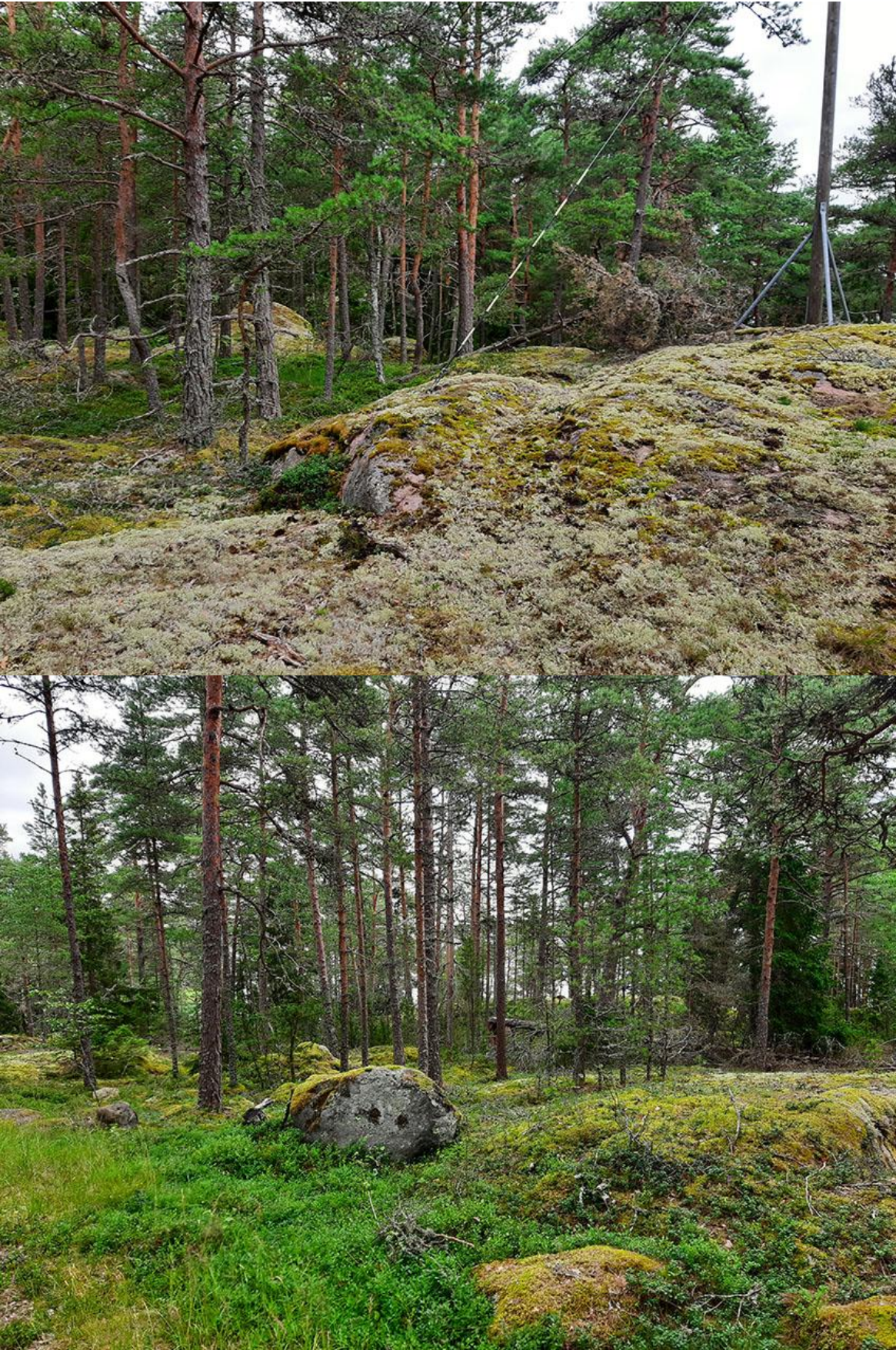
Kuvat 12-13. Korttelin 1 omakotitontin sisäosaa, mihin rakennusala on osoitettu.