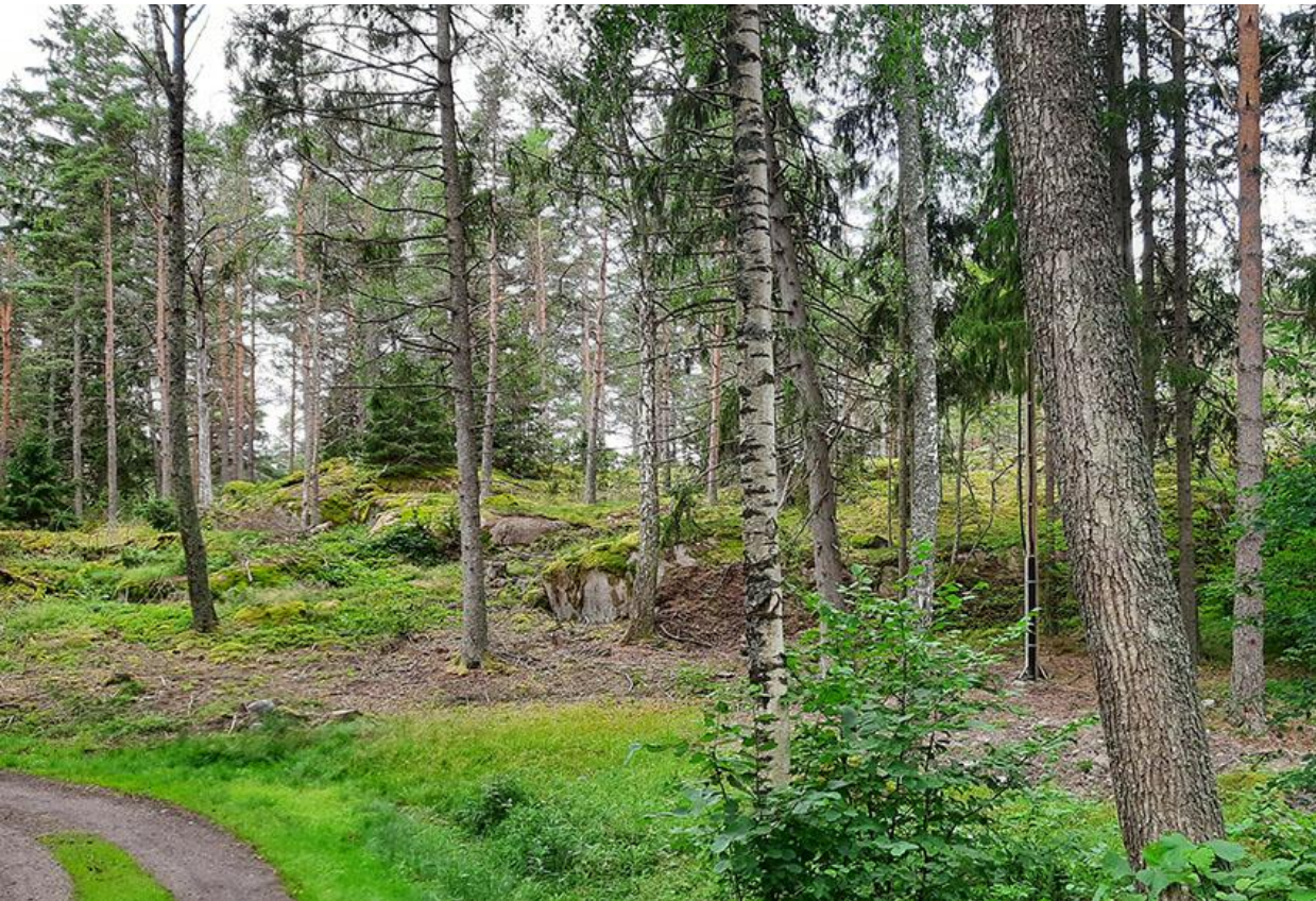
Kuva 7. Korttelin 1 käsittävän omakotitontin kaakkoisnurkka. Tontin rakennusala alkaa rinteän yläpuolella.