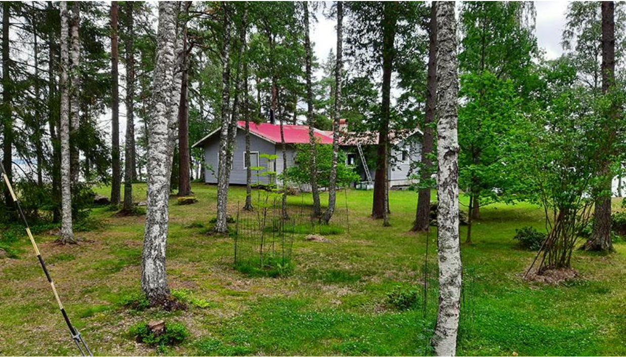
Kuva 1. Kiinteistön Myggsala 3-11 päärakennus.