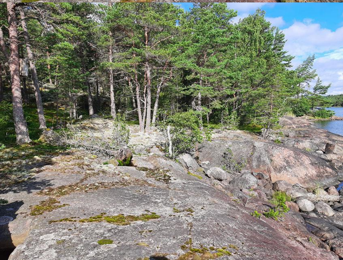
Kuvat 4 ja 5. Korttelin 3 tontin 1 rantaa.