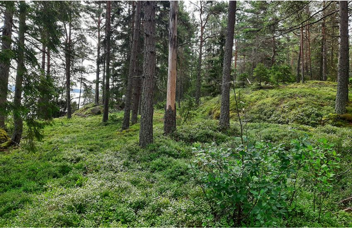
Kuva 6. Korttelin 3 tontin 1 sisäosaa.