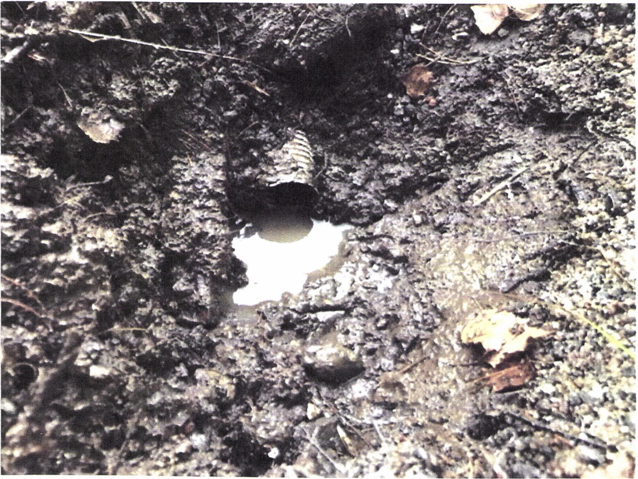
"SULKEMÄTÖN SALAOJAN PÄÄ"