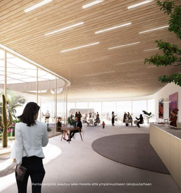
Rantapaviljonki avautuu sekä merelle että ympärivuotiseen talvipuutarhaan