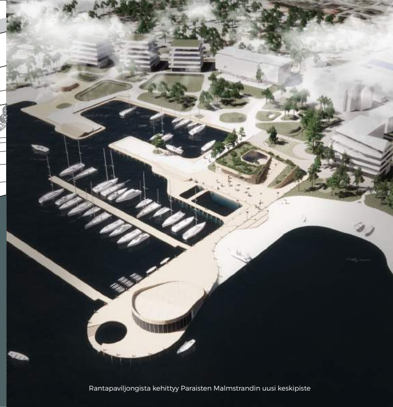
Rantapaviljongista kehittyi Paraisten Malmstrandin uusi keskipiste