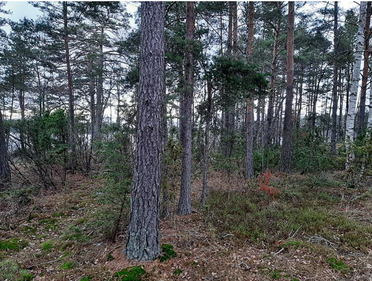
Kuva 8. Norra Svartholmsgrundet saaren sisäosaa.