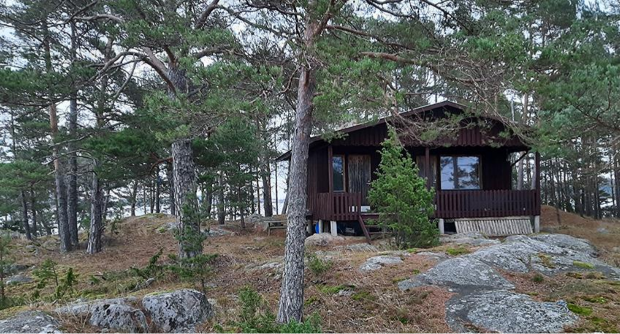
Kuva 2. Södra Svartholmsgrundet saaren mökki.

Kumpikin saari on kallioista kangasmetsää. Rannat ovat pääosin kallioisia. Paikoitellen kasvaa vaatimatonta kaislaa. Maisemakuvassa ne ovat yhtenäisiä metsäsaaria, mäntymetsä ulottuu kallioita lukuun ottamatta lähes rantaan. Rantavesi on monella paikalla syvää, mihin kummankin saaren laiturit on rakennettu.