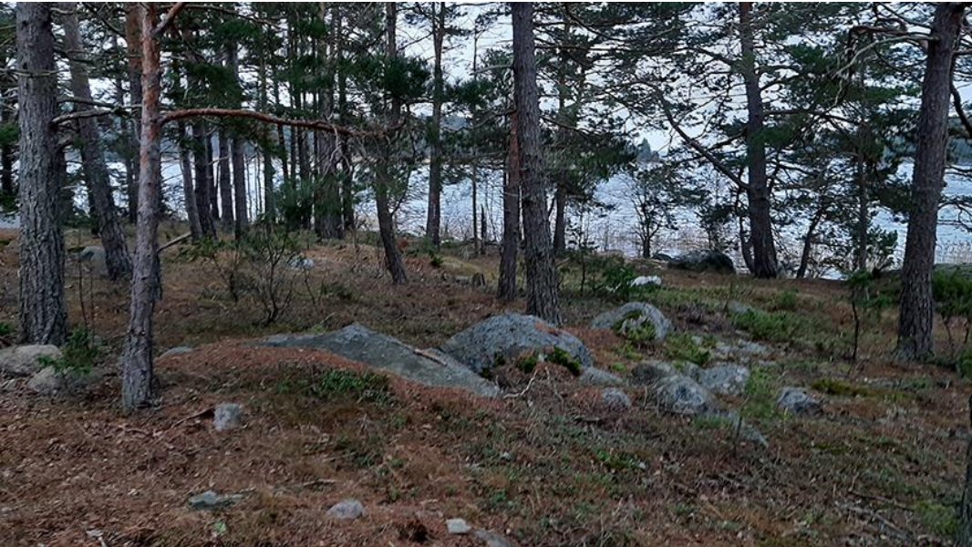
Kuva 9. Södra Svartholmsgrundet saaren sisäosaa kuvattuna mökiltä etelään.