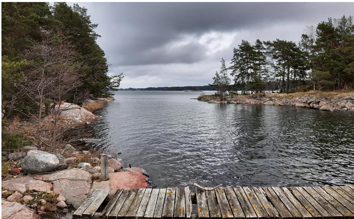
Kuva 5. Saarten välinen salmi kuvattuna lännestä.