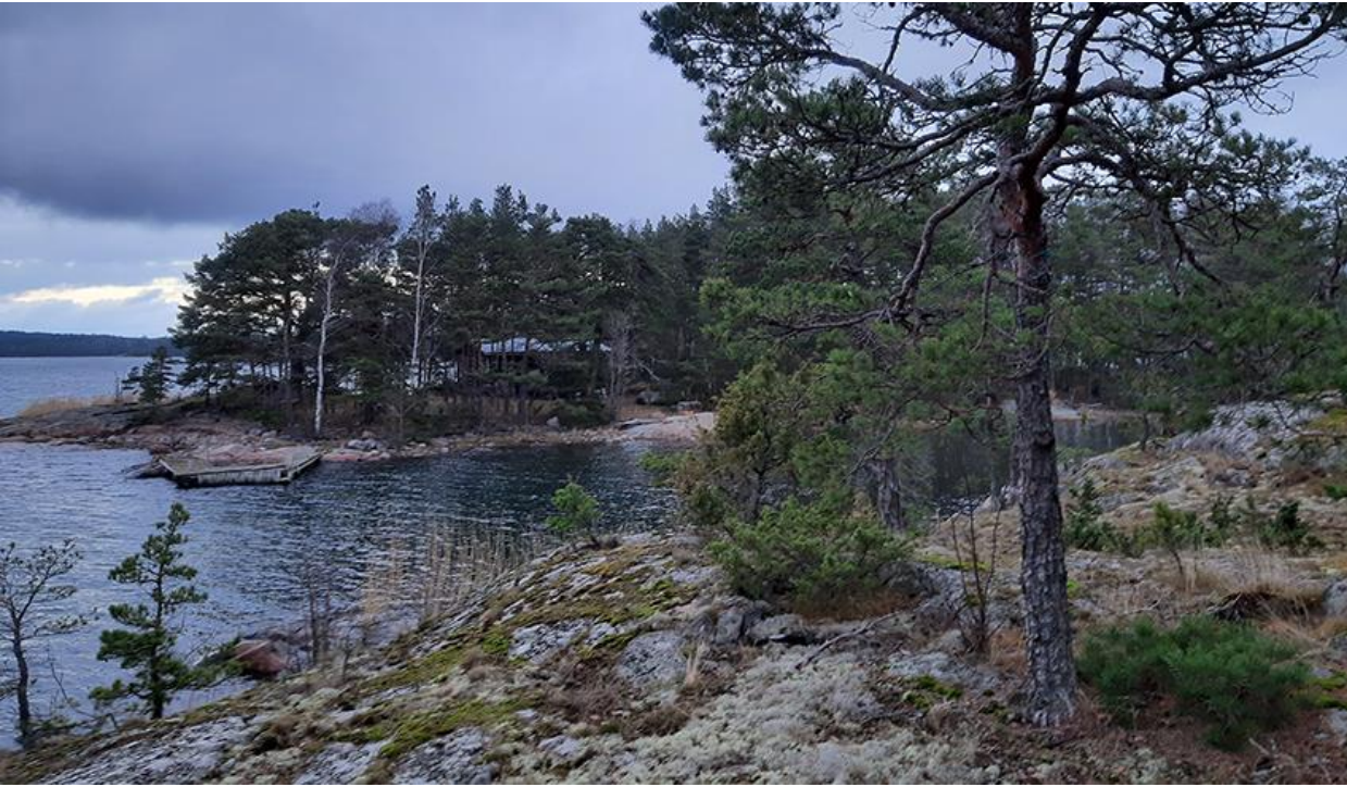
Kuva 7. Saarten välinen salmi kuvattuna Södra Svartholmsgrundet saaresta pohjoiseen.