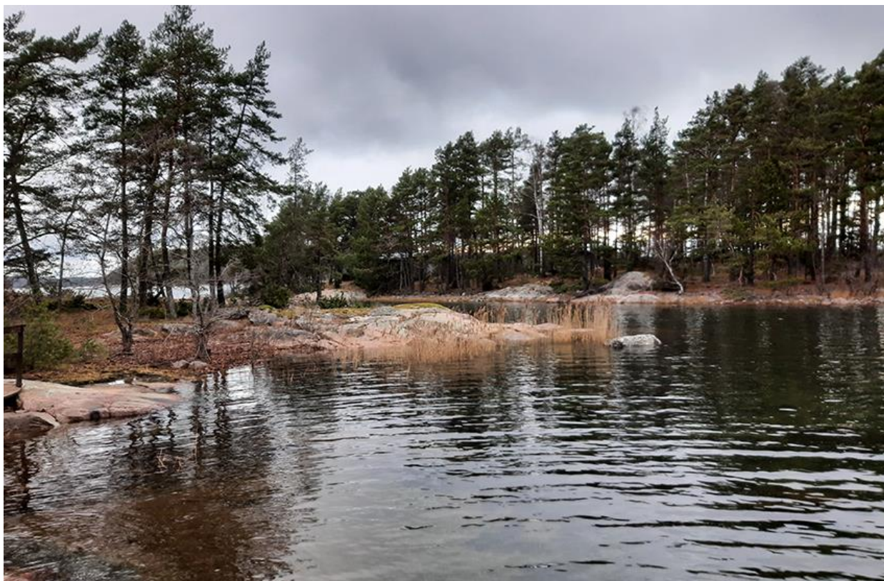
Kuva 6. Saarten välinen salmi kuvattuna Södra Svartholmsgrundet saaren itäpuolella olevasta laiturista luoteeseen.