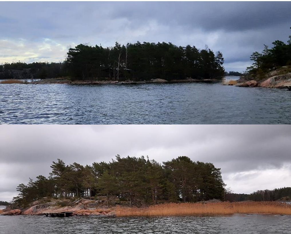
Kuvat 3-4. Saarten maisemakuva. Yllä Norra Svartholmsgrundet lounaasta, alla Södra Svartholmsgrundet lännestä. Saarten nimi saattaa viitata niiden tummaan maisemakuvaan.

Kumpikin saari on kallioista kangasmetsää. Rannat ovat pääosin kallioisia. Paikoitellen kasvaa vaatimatonta kaislaa. Maisemakuvassa ne ovat yhtenäisiä metsäsaaria, mäntymetsä ulottuu kallioita lukuun ottamatta lähes rantaan. Rantavesi on monella paikalla syvää, mihin kummankin saaren laiturit on rakennettu.