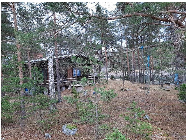
Kuva 1. Norra Svartholmsgrundet saaren mökki.

Saaret on kumpikin rakennettu identtisillä 40 m 2 :n suuruisilla loma-asunnoilla. Rakennusluvut on myönnetty v. 1977.