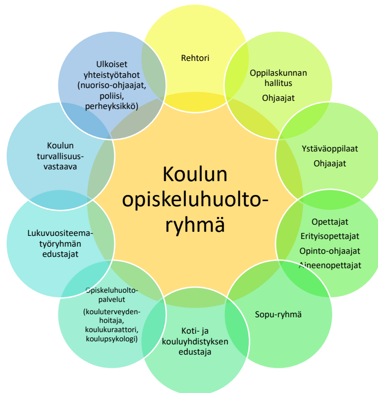
Kuva 3: Esimerkki koulukohtaisen opiskeluhoitoryhmän kokoonpanosta.

Jokaisella koululla on oma opiskeluhoitoryhmä, joka vastaa koulun opiskeluhoitotyön suunnittelusta, kehittämisestä, toteuttamisesta ja arvioinnista. Ryhmä voi olla myös useamman koulun yhteinen. Ryhmän tärkein tehtävä on hyvinvoinnin ja turvallisuuden edistäminen koulussa ja koulun yhteisöllisen opiskeluhoitollon muu kehittäminen. Opiskeluhoitoryhmä ei käsittele yksittäisiä oppilaita koskevia asioita.