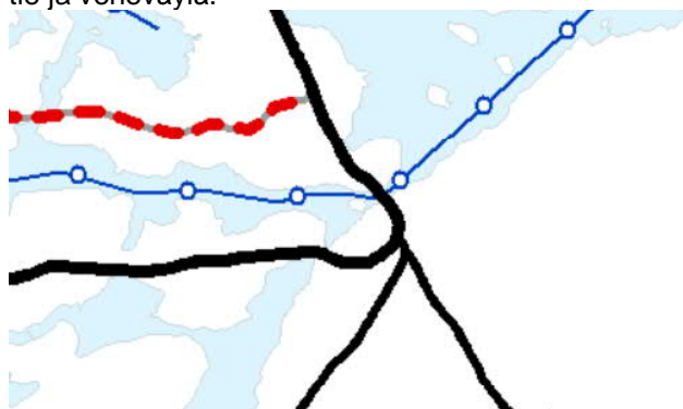
Kuva 3.3: Ote Varsinais-Suomen taajamien maankäytön, palveluiden ja liikenteen vaihemaakuntakaavasta.

Maakuntavaltuusto hyväksyi Varsinais-Suomen taajamien maankäytön, palveluiden ja liikenteen vaihemaakuntakaavan 11.6.2018. Maakuntahallitus määräsi 27.8.2018 vaihemaakuntakaavan tulemaan voimaan ennen kuin se on saanut lainvoiman. Maakuntavaltuuston hyväksymispäätöksestä jätettiin kaksi valitusta, jotka Turun hallinto-oikeus hylkäsi päätöksellään 1.10.2019. Korkein hallinto-oikeus hylkäsi päätöksellään 6.7.2020 hallinto-oikeuden päätöksestä tehdyn valituslupahakemuksen. Tässä kaavassa ei kaava-alueelle ole osoitettu kaavamerkintöjä. Kaavassa on todettu kaava-alueen vieressä kulkeva maantie ja veneväylä.