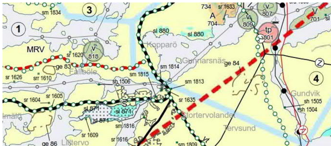
Kuva 3.1: Ote Varsinais-Suomen maakuntakaavasta.

Norrstrandenin tilan ohi kulkeva maantie 180 on osoitettu maakuntakaavassa seututienä ja ohjeellisena ulkoilureittinä.