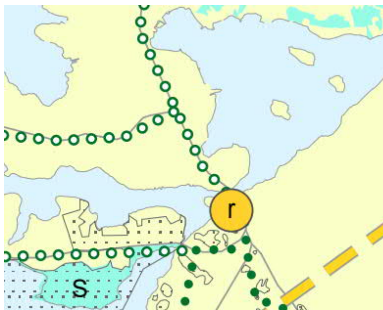
Kuva 3.2: Ote Varsinais-Suomen luonnonarvojen ja -varojen vaihemaakuntakaavasta.

Maakuntavaltuusto hyväksyi Varsinais-Suomen luonnonarvojen ja -varojen vaihemaakuntakaavan 14.6.2021. Maakuntahallitus määräsi kokouksessaan 13.9.2021 kaavan tulemaan voimaan maankäyttö- ja rakennuslain 201 §:n nojalla. Kaavassa alueelle on todettu retkeily- ja matkailutoimintojen kohde (r) sekä alueen Natura-alueet.