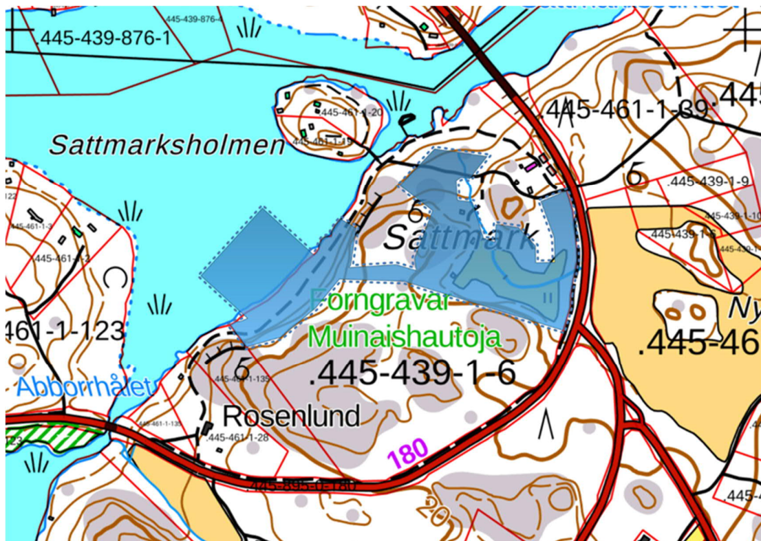
Kuva 2: Alustava kaava-alueen rajaus.

Oheisessa kartassa on sinisellä värillä alustava kaava-alueen rajaus. Sen pinta-ala on noin 5,5 hehtaaria.