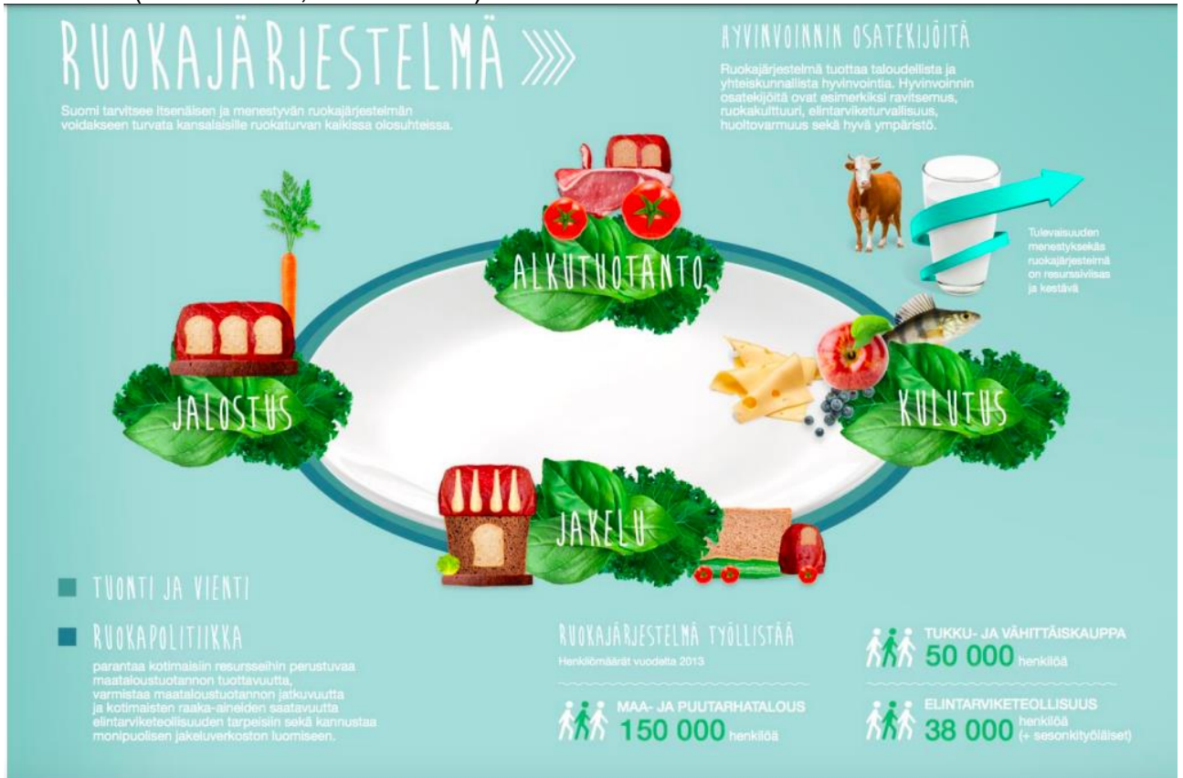
KUVA 1.

Kuluttajat ovat kiinnostuneita ruuan alkuperästä samaan aikaan kun globaalit ruokajärjestelmät häivyttävät alkuperää. Ruuan ravintosisältö ja alkuperä luetaan elintarvikepakkausten tuoteselosteista, mutta sen lisäksi ruualta odotetaan elämyksellisyyttä mm. tarinallistamista ruuan kulusta kuluttajalle.